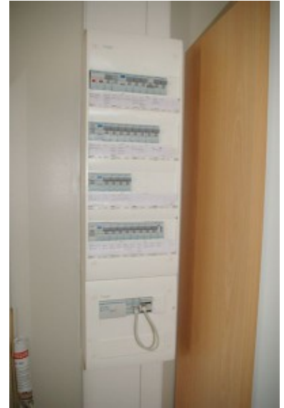
▪ tableau électrique